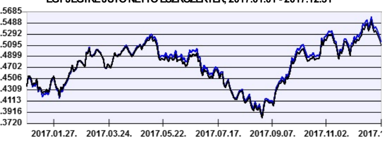
EGY JEGYRE JUTÓ NETTÓ ESZKÖZÉRTÉK, 2017.01.01 - 2017.12.31

Aegon Nemzetközi Részvény Befektetési Alap intézményi sorozat — Benchmark A múltbeli hozamok nem jelentenek garanciát az alap jövőbeli teljesítményére nézve. Jelen hirdetés nem minősül ajánlattételnek vagy befektetési tanácsadásnak. A befektetés részletes feltételeit az Alap Tájékoztatója tartalmazza, mely a mindenkor érvényes kondíciós listákkal együtt megtalálható a forgalmazási helyeken. A befektetési alap forgalmazásával (vétel, tartás, eladás) kapcsolatos költségek az alap kezelési szabályzatában és a forgalmazási helyeken megismerhetők.