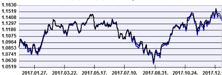
Egy jegyre jutó nettó eszközérték, 2017.01.01 - 2017.12.31

----- Aegon Nemzetközi Részvény Befektetési Alap EUR sorozat ----- Benchmark