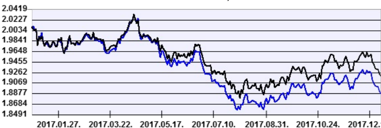
EGY JEGYRE JUTÓ NETTÓ ESZKÖZÉRTÉK, 2017.01.01 - 2017.12.31

----- Aegon Nemzetközi Kötvény Befektetési Alap ----- Benchmark