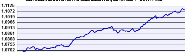
— Aegon Tempó Andante 2 Alapokba Fektető Részalap

A múltbeli hozamok nem jelentenek garanciát az alap jövőbeli teljesítményére nézve. Jelen hirdetés nem minősül ajánlattételnek vagy befektetési tanácsadásnak. A befektetés részletes feltételeit az Alap Tájékoztatója tartalmazza, mely a mindenkor érvényes kondíciós listával együtt megtalálható a forgalmazási helyeken. A befektetési alap forgalmazásával (vétel, tartás, eladás) kapcsolatos költségek az alap kezelési szabályzatában és a forgalmazási helyeken megismerhetők.