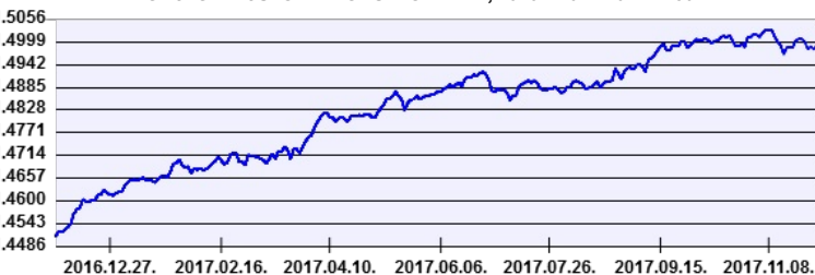
EGY JEGYRE JUTÓ NETTÓ ESZKÖZÉRTÉK, 2016.12.01 - 2017.11.30

----- Aegon Smart Money Befektetési Alapok Alapja ----- Benchmark