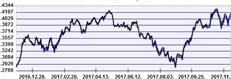
EGY JEGYRE JUTÓ NETTÓ ESZKÖZÉRTÉK, 2016.12.01 - 2017.11.30

----- Aegon Nemzetközi Részvény Befektetési Alap HUF sorozat ----- Benchmark