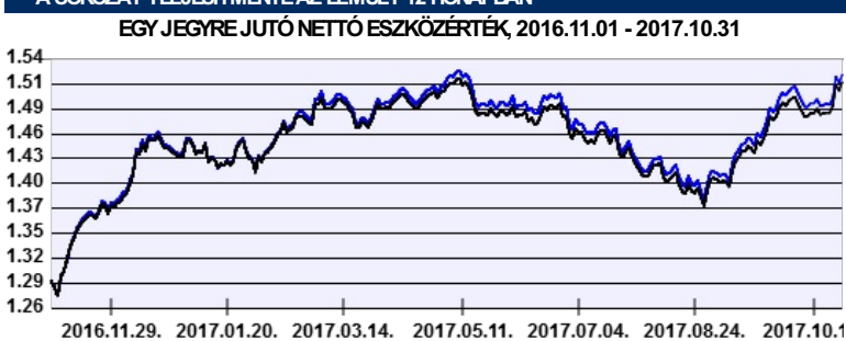
EGY JEGYRE JUTÓ NETTÓ ESZKÖZÉRTÉK, 2016.11.01 - 2017.10.31