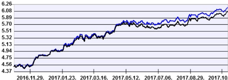
EGY JEGYRE JUTÓ NETTÓ ESZKÖZÉRTÉK, 2016.11.01 - 2017.10.31

--- Aegon Közép-Európai Részvény Befektetési Alap intézményi sorozat