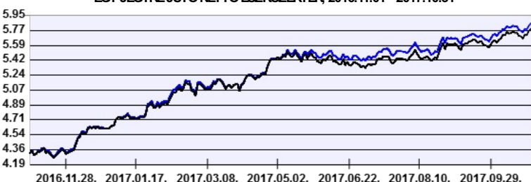
EGY JEGYRE JUTÓ NETTÓ ESZKÖZÉRTÉK, 2016.11.01 - 2017.10.31

--- Aegon Közép-Európai Részvény Befektetési Alap HUF sorozat --- Benchmark