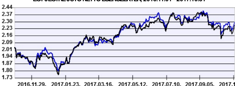
EGY JEGYRE JUTÓ NETTÓ ESZKÖZÉRTÉK, 2016.11.01 - 2017.10.31

— Aegon Istanbul Részvény Befektetési Alap intézményi sorozat — Benchmark A múltbeli hozamok nem jelentenek garanciát az alap jövőbeli teljesítményére nézve. Jelen hirdetés nem minősül ajánlattételnek vagy befektetési tanácsadásnak. A befektetés részletes feltételeit az Alap Tájékoztatója tartalmazza, mely a mindenkor érvényes kondíciós listákkal együtt megtalálható a forgalmazási helyeken. A befektetési alap forgalmazásával (vétel, tartás, eladás) kapcsolatos költségek az alap kezelési szabályzatában és a forgalmazási helyeken megismerhetők.