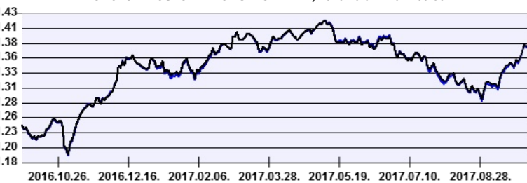
EGY JEGYRE JUTÓ NETTÓ ESZKÖZÉRTÉK 2016.10.01 - 2017.09.30

----- Aegon Nemzetközi Részvény Befektetési Alap HUF sorozat ----- Benchmark