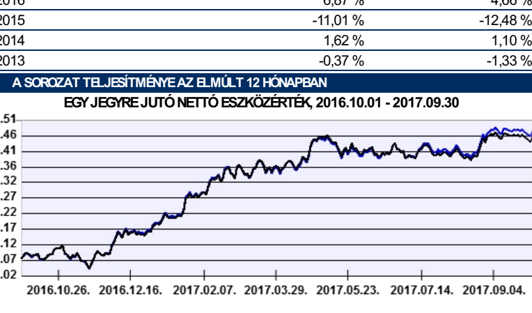
EGY JEGYRE JUTÓ NETTÓ ESZKÖZÉRTÉK, 2016.10.01 - 2017.09.30

A múltbeli hozamok nem jelentenek garanciát az alap jövőbeli teljesítményére nézve. Jelen hirdetés nem minősül ajánlattételnek vagy befektetési tanácsadásnak. A befektetés részletes feltételeit az Alap Tájékoztatója tartalmazza, mely a mindenkor érvényes kondíciós listákkal egyúttal megtalálható a forgalmazási helyeken. A befektetési alap forgalmazásával (vétel, tartás, eladás) kapcsolatos költségek az alap kezelési szabályzatában és a forgalmazási helyeken megismerhetők.