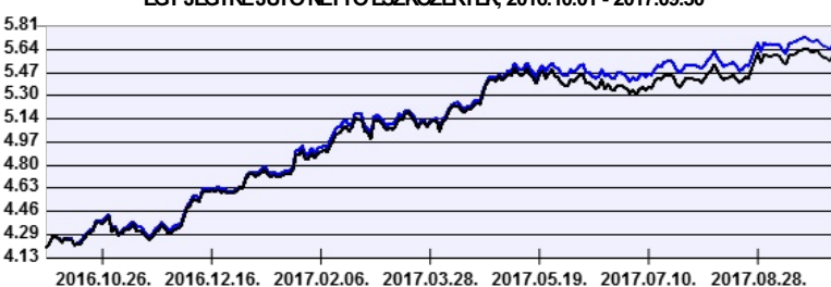
EGY JEGYRE JUTÓ NETTÓ ESZKÖZÉRTÉK, 2016.10.01 - 2017.09.30

--- Aegon Közép-Európai Részvény Befektetési Alap HUF sorozat --- Benchmark