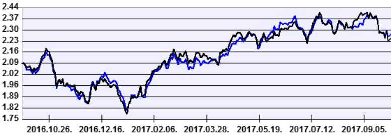
EGY JEGYRE JUTÓ NETTÓ ESZKÖZÉRTÉK, 2016.10.01 - 2017.09.30