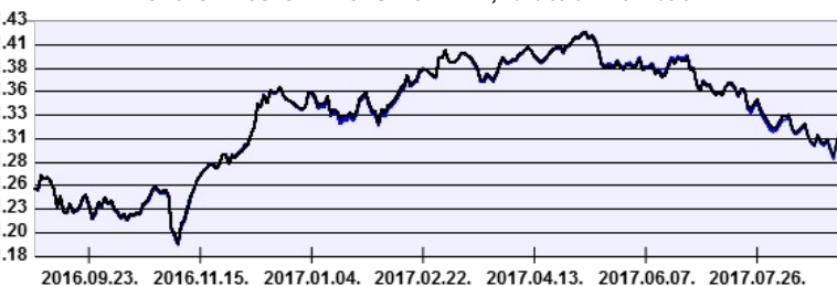
EGY JEGYRE JUTÓ NETTÓ ESZKÖZÉRTÉK, 2016.09.01 - 2017.08.31

----- Aegon Nemzetközi Részvény Befektetési Alap HUF sorozat ----- Benchmark