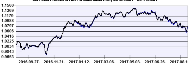
EGY JEGYRE JUTÓ NETTÓ ESZKÖZÉRTÉK, 2016.09.01 - 2017.08.31

----- Aegon Nemzetközi Részvény Befektetési Alap EUR sorozat ----- Benchmark