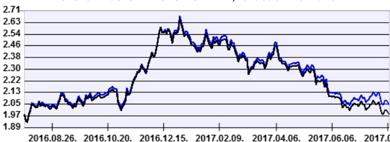
EGY JEGYRE JUTÓ NETTÓ ESZKÖZÉRTÉK, 2016.08.01 - 2017.07.31

— Aegon Russia Részvény Befektetési Alap intézményi sorozat — Benchmark