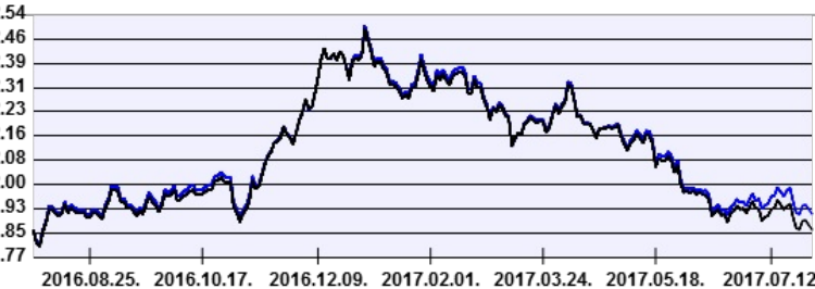
— Aegon Russia Részvény Befektetési Alap HUF sorozat — Benchmark

A múltbeli hozamok nem jelentenek garanciát az alap jövőbeli teljesítményére nézve. Jelen hirdetés nem minősül ajánlattételnek vagy befektetési tanácsadásnak. A befektetés részletes feltételeit az Alap Tájékoztatója tartalmazza, mely a mindenkor érvényes kondíciós listákkal együtt megtalálható a forgalmazási helyeken. A befektetési alap forgalmazásával (vétel, tartás, eladás) kapcsolatos költségek az alap kezelési szabályzatában és a forgalmazási helyeken megismerhetők.