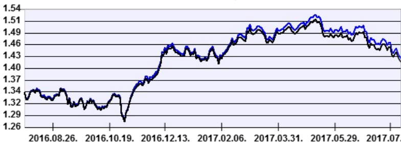
EGY JEGYRE JUTÓ NETTÓ ESZKÖZÉRTÉK, 2016.08.01 - 2017.07.31

— Aegon Nemzetközi Részvény Befektetési Alap intézményi sorozat — Benchmark