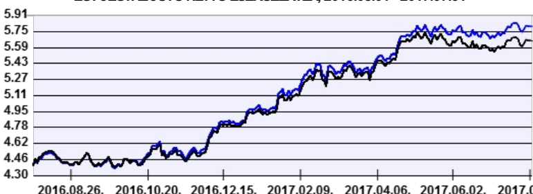
EGY JEGYRE JUTÓ NETTÓ ESZKÖZÉRTÉK, 2016.08.01 - 2017.07.31

--- Aegon Közép-Európai Részvény Befektetési Alap intézményi sorozat