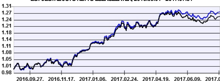
EGY JEGYRE JUTÓ NETTÓ ESZKÖZÉRTÉK, 2016.09.01 - 2017.07.31

— Aegon Közép-Európai Részvény Befektetési Alap CZK sorozat — Benchmark