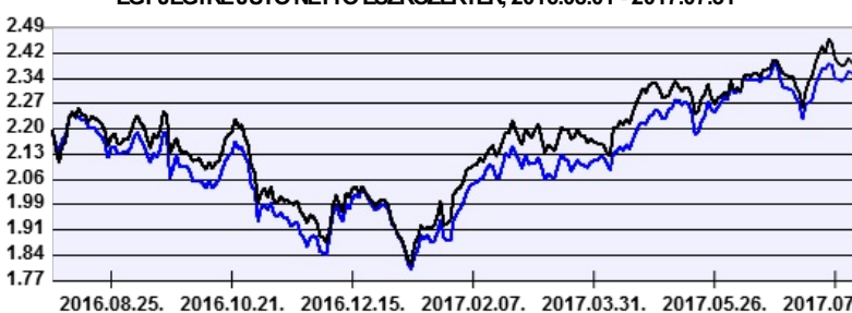
EGY JEGYRE JUTÓ NETTÓ ESZKÖZÉRTÉK, 2016.08.01 - 2017.07.31

— Aegon IstanBull Részvény Befektetési Alap intézményi sorozat — Benchmark