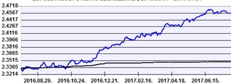
— Aegon Alfa Abszolút Hozamú Befektetési Alap PLN sorozat — Benchmark

A múltbeli hozamok nem jelentenek garanciát az alap jövőbeli teljesítményére nézve. Jelen hirdetés nem minősül ajánlattételnek vagy befektetési tanácsadásnak. A befektetés részletes feltételeit az Alap Tájékoztatója tartalmazza, mely a mindenkor érvényes kondíciós listákkal együtt megtalálható a forgalmazási helyeken. A befektetési alap forgalmazásával (vétel, tartás, eladás) kapcsolatos költségek az alap kezelési szabályzatában és a forgalmazási helyeken megismerhetők.