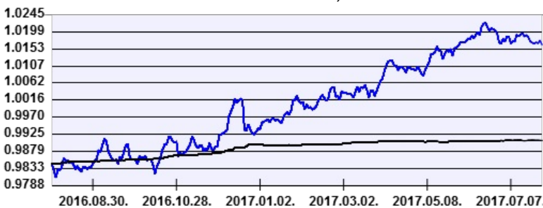
— Aegon Alfa Abszolút Hozamú Befektetési Alap CZK sorozat — Benchmark

A múltbeli hozamok nem jelentenek garanciát az alap jövőbeli teljesítményére nézve. Jelen hirdetés nem minősül ajánlattételnek vagy befektetési tanácsadásnak. A befektetés részletes feltételeit az Alap Tájékoztatója tartalmazza, mely a mindenkor érvényes kondíciós listákkal együtt megtalálható a forgalmazási helyeken. A befektetési alap forgalmazásával (vétel, tartás, eladás) kapcsolatos költségek az alap kezelési szabályzatában és a forgalmazási helyeken megismerhetők.