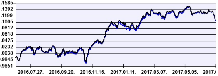
A SOROZAT TELJESÍTMÉNYE AZ ELMÚLT 12 HÓNAPBAN EGY JEGYRE JUTÓ NETTÓ ESZKÖZÉRTÉK, 2016.07.01 - 2017.06.30

— Aegon Nemzetközi Részvény Befektetési Alap EUR sorozat — Benchmark A múltbeli hozamok nem jelentenek garanciát az alap jövőbeli teljesítményére nézve. Jelen hirdetés nem minősül ajánlattételnek vagy befektetési tanácsadásnak. A befektetés részletes feltételeit az Alap Tájékoztatója tartalmazza, mely a mindenkor érvényes kondíciók listákkal együtt megtalálható a forgalmazási helyeken. A befektetési alap forgalmazásával (vétel, tartás, eladás) kapcsolatos költségek az alap kezelési szabályzatában és a forgalmazási helyeken megismerhetők.