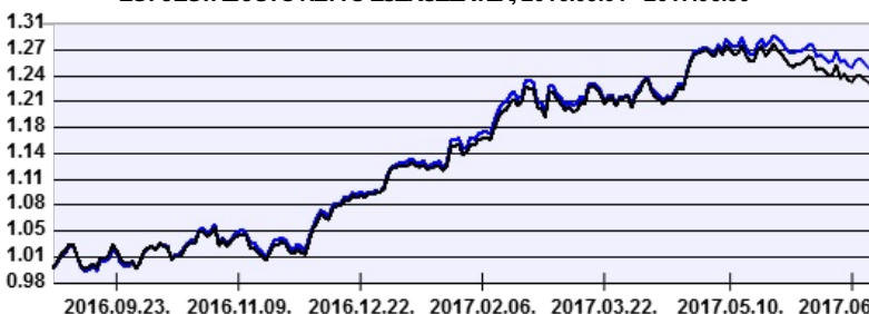
EGY JEGYRE JUTÓ NETTÓ ESZKÖZÉRTÉK, 2016.09.01 - 2017.06.30

— Aegon Közép-Európai Részvény Befektetési Alap CZK sorozat — Benchmark