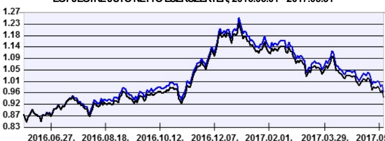
EGY JEGYRE JUTÓ NETTÓ ESZKÖZÉRTÉK, 2016.06.01 - 2017.05.31

— Aegon Russia Részvény Befektetési Alap PI sorozat — Benchmark A múltbeli hozamok nem jelentenek garanciát az alap jövőbeli teljesítményére nézve. Jelen hirdetés nem minősül ajánlattételnek vagy befektetési tanácsadásnak. A befektetés részletes feltételeit az Alap Tájékoztatója tartalmazza, mely a mindenkor érvényes kondíciós listákkal együtt megtalálható a forgalmazási helyeken. A befektetési alap forgalmazásával (vétel, tartás, eladás) kapcsolatos költségek az alap kezelési szabályzatában és a forgalmazási helyeken megismerhetők.