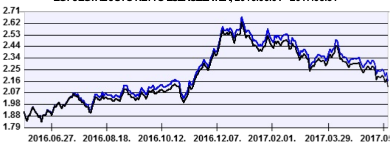
EGY JEGYRE JUTÓ NETTÓ ESZKÖZÉRTÉK, 2016.06.01 - 2017.05.31

— Aegon Russia Részvény Befektetési Alap intézményi sorozat — Benchmark