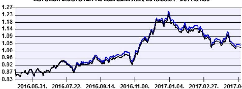
EGY JEGYRE JUTÓ NETTÓ ESZKÖZÉRTÉK, 2016.05.01 - 2017.04.30

A múltbeli hozamok nem jelentenek garanciát az alap jövőbeli teljesítményére nézve. Jelen hirdetés nem minősül ajánlattételnek vagy befektetési tanácsadásnak. A befektetés részletes feltételeit az Alap Tájékoztatója tartalmazza, mely a mindenkor érvényes kondíciós listákkal együtt megtalálható a forgalmazási helyeken. A befektetési alap forgalmazásával (vétel, tartás, eladás) kapcsolatos költségek az alap kezelési szabályzatában és a forgalmazási helyeken megismerhetők.