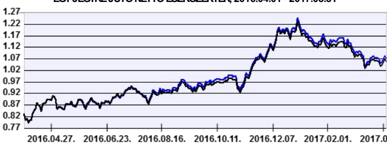
EGY JEGYRE JUTÓ NETTÓ ESZKÖZÉRTÉK, 2016.04.01 - 2017.03.31

— Aegon Russia Részvény Befektetési Alap PI sorozat — Benchmark