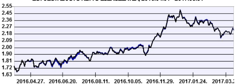
EGY JEGYRE JUTÓ NETTÓ ESZKÖZÉRTÉK, 2016.04.01 - 2017.03.31

A múltbeli hozamok nem jelentenek garanciát az alap jövőbeli teljesítményére nézve. Jelen hirdetés nem minősül ajánlattételnek vagy befektetési tanácsadásnak. A befektetés részletes feltételeit az Alap Tájékoztatója tartalmazza, mely a mindenkor érvényes kondíciók listákkal együtt megtalálható a forgalmazási helyeken. A befektetési alap forgalmazásával (vétel, tartás, eladás) kapcsolatos költségek az alap kezelési szabályzatában és a forgalmazási helyeken megismerhetők.