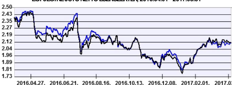
EGY JEGYRE JUTÓ NETTÓ ESZKÖZÉRTÉK, 2016.04.01 - 2017.03.31

— Aegon IstanBull Részvény Befektetési Alap intézményi sorozat — Benchmark