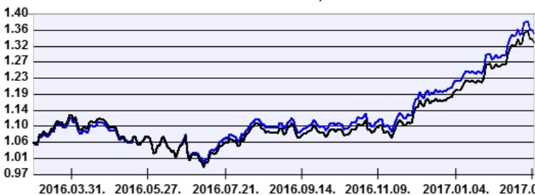
EGY JEGYRE JUTÓ NETTÓ ESZKÖZÉRTÉK, 2016.02.29 - 2017.02.28

— Aegon Lengyel Részvény Befektetési Alap intézményi sorozat — Benchmark