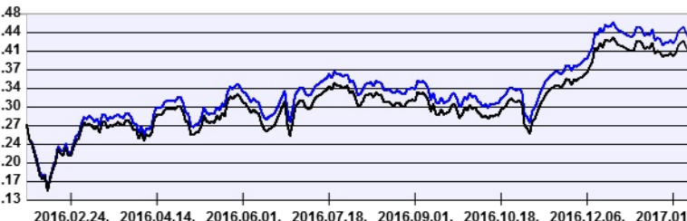
EGY JEGYRE JUTÓ NETTÓ ESZKÖZÉRTÉK, 2016.02.01 - 2017.01.31

— Aegon Nemzetközi Részvény Befektetési Alap intézményi sorozat — Benchmark