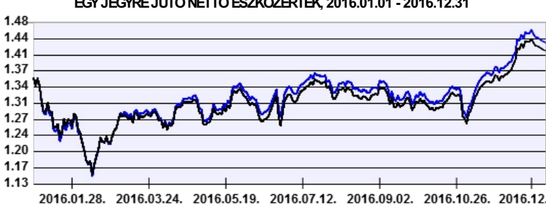
EGY JEGYRE JUTÓ NETTÓ ESZKÖZÉRTÉK, 2016.01.01 - 2016.12.31

— Aegon Nemzetközi Részvény Befektetési Alap intézményi sorozat — Benchmark