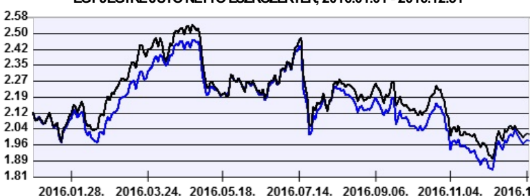
EGY JEGYRE JUTÓ NETTÓ ESZKÖZÉRTÉK, 2016.01.01 - 2016.12.31

— Aegon IstanBull Részvény Befektetési Alap intézményi sorozat — Benchmark