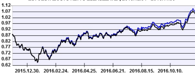
EGY JEGYRE JUTÓ NETTÓ ESZKÖZÉRTÉK, 2015.12.01 - 2016.11.30

A múltbeli hozamok nem jelentenek garanciát az alap jövőbeli teljesítményére nézve. Jelen hirdetés nem minősül ajánlattételnek vagy befektetési tanácsadásnak. A befektetés részletes feltételeit az Alap Tájékoztatója tartalmazza, mely a mindenkor érvényes kondíciós listával együtt megtalálható a forgalmazási helyeken. A befektetési alap forgalmazásával (vétel, tartás, eladás) kapcsolatos költségek az alap kezelési szabályzatában és a forgalmazási helyeken megismerhetők.