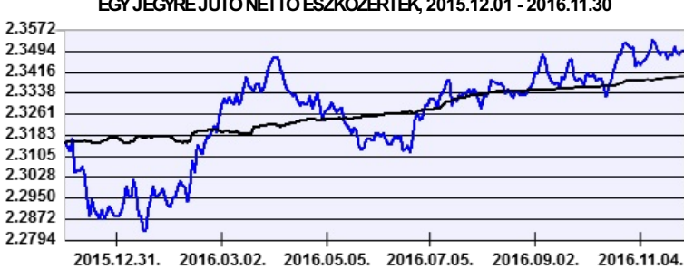
EGY JEGYRE JUTÓ NETTÓ ESZKÖZÉRTÉK, 2015.12.01 - 2016.11.30

— Aegon Alfa Abszolút Hozamú Befektetési Alap PLN sorozat — Benchmark