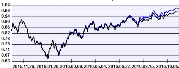
EGY JEGYRE JUTÓ NETTÓ ESZKÖZÉRTÉK, 2015.11.01 - 2016.10.31

— Aegon Russia Részvény Befektetési Alap PI sorozat — Benchmark