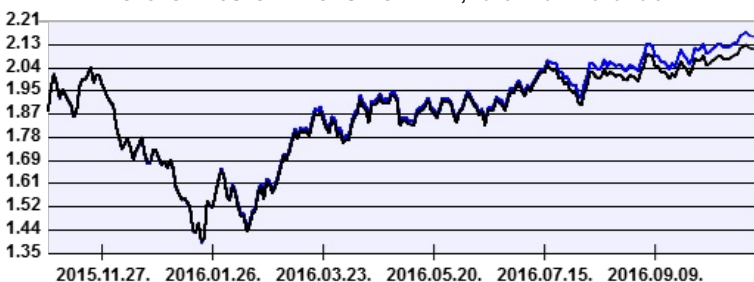
EGY JEGYRE JUTÓ NETTÓ ESZKÖZÉRTÉK, 2015.11.01 - 2016.10.31

— Aegon Russia Részvény Befektetési Alap intézményi sorozat — Benchmark