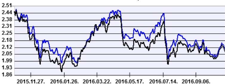
EGY JEGYRE JUTÓ NETTÓ ESZKÖZÉRTÉK, 2015.11.01 - 2016.10.31

— Aegon IstanBull Részvény Befektetési Alap intézményi sorozat — Benchmark