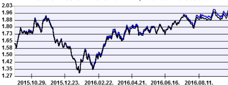
EGY JEGYRE JUTÓ NETTÓ ESZKÖZÉRTÉK, 2015.10.01 - 2016.09.30

— Aegon Russia Részvény Befektetési Alap HUF sorozat — Benchmark