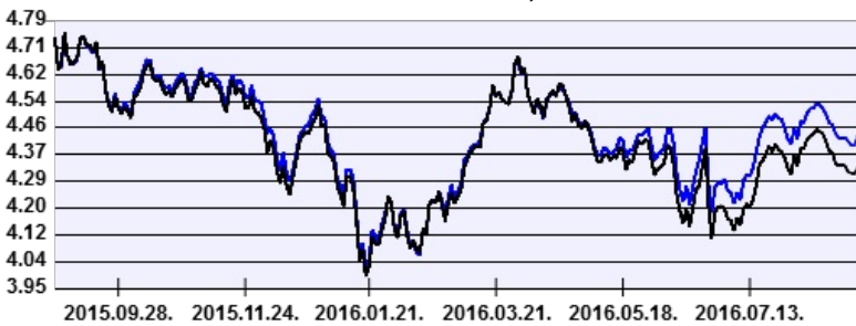
EGY JEGYRE JUTÓ NETTÓ ESZKÖZÉRTÉK, 2015.09.01 - 2016.08.31

— Aegon Közép-Európai Részvény Befektetési Alap intézményi sorozat — Benchmark