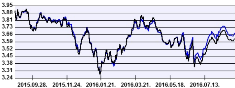
EGY JEGYRE JUTÓ NETTÓ ESZKÖZÉRTÉK, 2015.09.01 - 2016.08.31

— Aegon Közép-Európai Részvény Befektetési Alap EUR sorozat — Benchmark