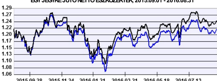
EGY JEGYRE JUTÓ NETTÓ ESZKÖZÉRTÉK, 2015.09.01 - 2016.08.31

— Aegon Climate Change Részvény Befektetési Alap HUF sorozat — Benchmark