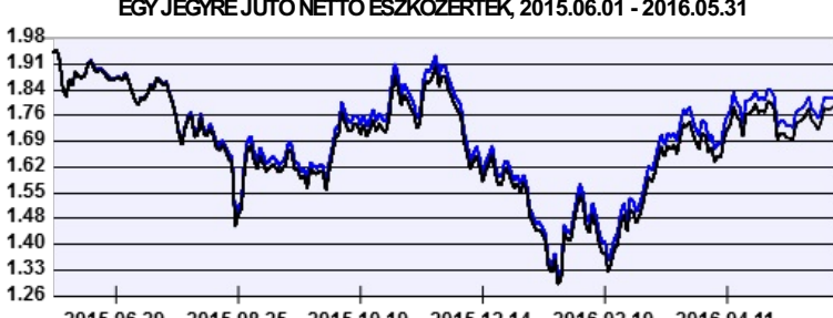
EGY JEGYRE JUTÓ NETTÓ ESZKÖZÉRTÉK, 2015.06.01 - 2016.05.31

— Aegon Russia Részvény Befektetési Alap HUF sorozat — Benchmark