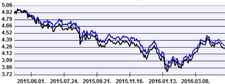
EGY JEGYRE JUTÓ NETTÓ ESZKÖZÉRTÉK, 2015.05.01 - 2016.04.30

— Aegon Közép-Európai Részvény Befektetési Alap HUF sorozat — Benchmark