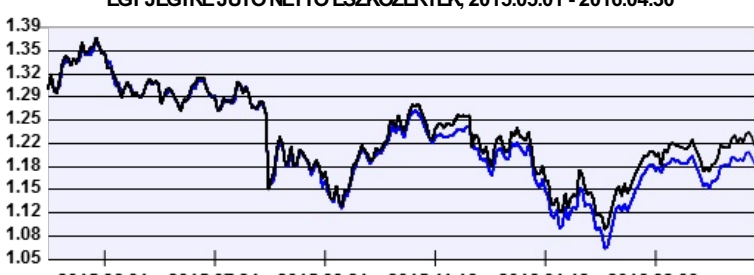
EGY JEGYRE JUTÓ NETTÓ ESZKÖZÉRTÉK, 2015.05.01 - 2016.04.30

— Aegon Climate Change Részvény Befektetési Alap HUF sorozat — Benchmark