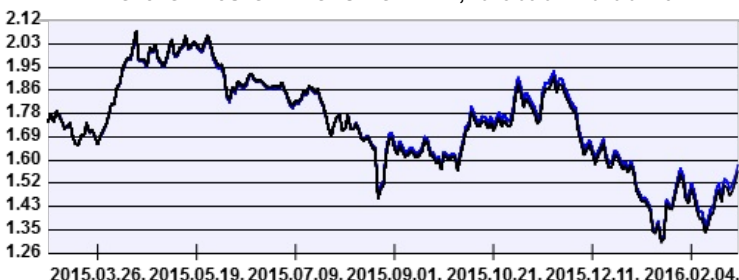
EGY JEGYRE JUTÓ NETTÓ ESZKÖZÉRTÉK, 2015.03.01 - 2016.02.29

— Aegon Russia Részvény Befektetési Alap HUF sorozat — Benchmark