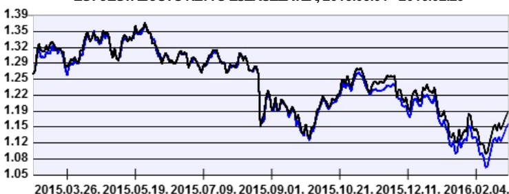
EGY JEGYRE JUTÓ NETTÓ ESZKÖZÉRTÉK, 2015.03.01 - 2016.02.29

— Aegon Climate Change Részvény Befektetési Alap HUF sorozat — Benchmark